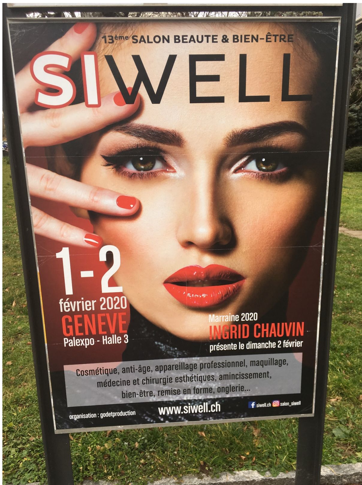
Affiche publicitaire pour le salon Siwell , godetproduction, 2019-2020.